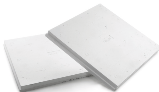
Verlegeschema A: mit flapor-Gefälledämmplatten