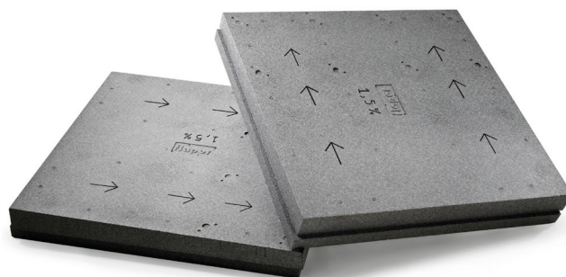
Verlegeschema A: mit flapor plus-Gefälledämmplatten