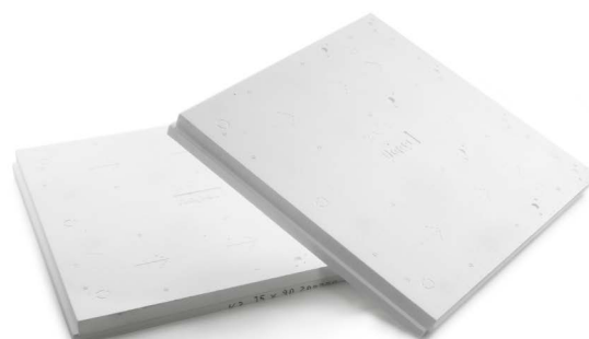
Verlegeschema A: mit flapor-Gefälledämmplatten